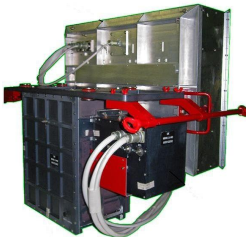
Рис. 1 Фурье-спектрометр ИКФС-2

публикации по данному направлению освещают преимущественно теоретические аспекты данного вопроса, и итоговые результаты измерений и испытаний. Конфиденциальность отдельных данных и практической реализации измерительных приборов обусловлена государственной и коммерческой тайной по использованию данных приборов для дистанционного зондирования земли с использованием искусственных спутников, летательных аппаратов или стационарных постов.