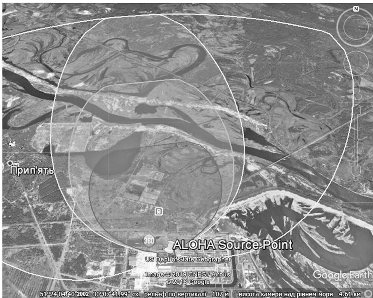
Рисунок 3 — Зона радіоактивного забруднення атмосфери під час аварії на Чорнобильській АЕС на момент 102 хв від вибуху реактора: S_{НС} = 23 \text{ км}^2

небезпечних газоподібних та дисперсних речовин, який складається із 14 блоків, розміщених на трьох ієрархічних рівнях, зв'язаних прямими та зворотними зв'язками.