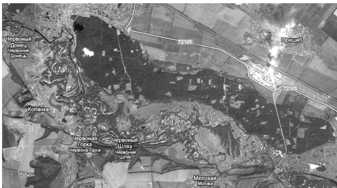
Рис. 1 – Космический снимок [7] Борисоглебского бора (Высокоборское лесничество). В правом верхнем углу прослеживается дымовой шлейф выбросов “Балцем”

коэффициенты которых a_{uv}^{st} получены из условий гладкой сшивки C_{st}(x, y) с использованием метода Кунса [6].