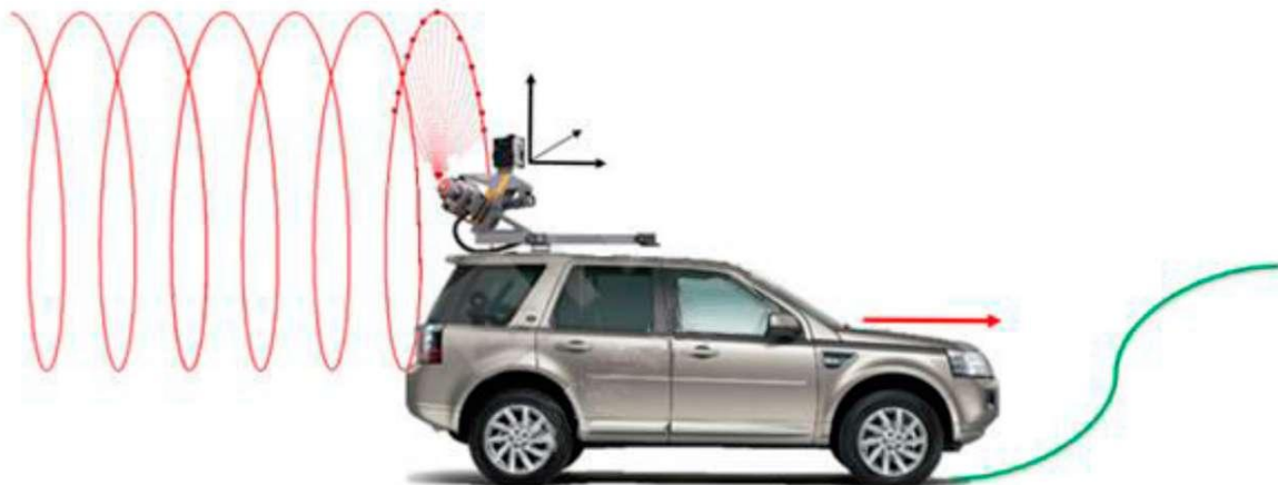
Рис. 1 – Візуалізація процесу отримання даних з використанням скануючої системи Alfa 3D, яка була встановлена на даху автомобіля

У проєкті, на початковому етапі, для отримання даних виконувалося МЛС за допомогою скануючої системи Alfa 3D, яка була встановлена на даху автомобіля підвищеної прохідності (рис. 1).