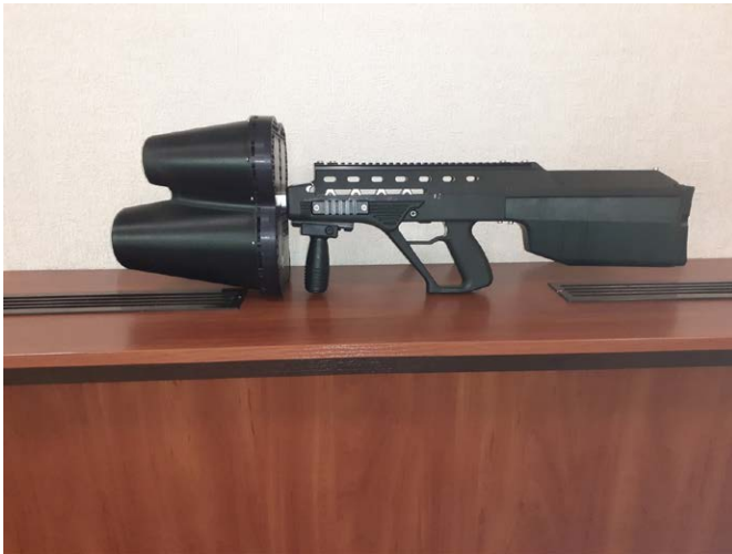
Рис. 1. Зовнішній вигляд зразка.