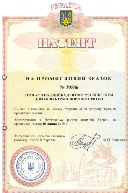
Рис. 2. Патент на промисловий зразок «Трафаретна лінійка для оформлення схем дорожньо-транспортних пригод»

На трафаретній лінійці зображені піктограми засобів організації дорожнього руху (дорожні знаки, напрям руху, світлофор, пішохідний перехід, острівець безпеки, огорожа), а також графічні відтворення транспортних засобів (вантажівка, легкове авто, автобус, тролейбус, трамвай, мікроавтобус, велосипед, мотоцикл, мотоцикл з боковим причепом, напівпричіп, сідловий тягач, причіп вантажний, причіп легковий та ін.). Наведені також інші піктограми – труп людини, що дозволяє зобразити його на схемі місця події відповідно до реальної обстановки та геометричні фігури, які спрощують позначення об'єктів дорожньої інфраструктури на схемі дорожньо-транспортної пригоди. Трафаретна лінійка містить масштабну шкалу, яка має сантиметрові цифрові позначки (вимірювання лінійних розмірів об'єктів) та інші графічні елементи (позначення ширини смуги руху (3 м), колії залізниці та трамваю (1,52 м) й колії трамваю (1 м), заокруглення проїзної частини різних радіусів) тощо.