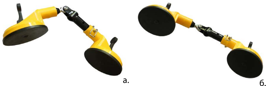
Рис. 3. Загальний вид фіксуючої рамки з вакуумними присосками

Пристрій складається з двох окремих елементів – фіксуючої рамки з вакуумними присосками та корпусу ударного інерційного молота (рис. 3 (а, б), рис. 4).