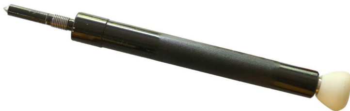
Рис. 4. Загальний вид ударного інерційного молоту

Спеціальний пристрій для примусового відкриття транспортних засобів «WINCRUSHER» дозволяє достатньо швидко, якісно та максимально безпечно здійснити примусове відкриття транспортного засобу шляхом руйнування будь-якого з бічних стекол автомобіля.