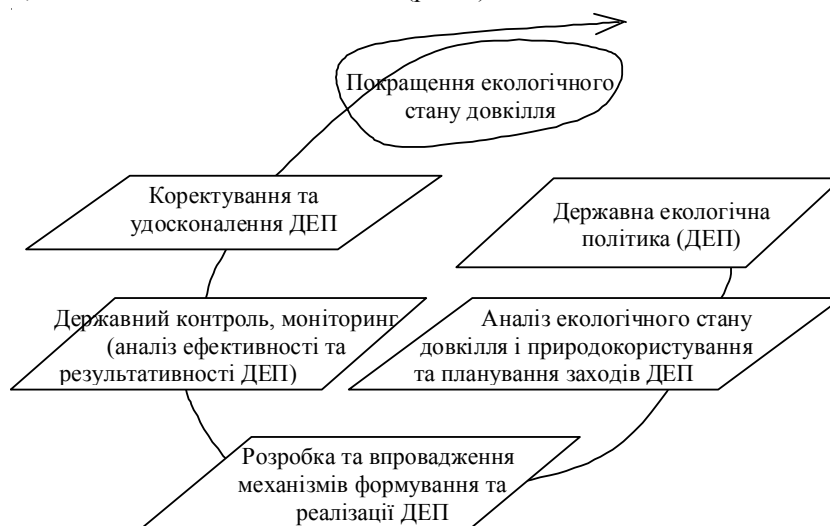
Рис. 2. Етапи формування та реалізації державної екологічної політики

Нагальним завданням державної екологічної політики є проведення поступової інституційної реформи державної системи охорони довкілля та використання природних ресурсів, які можна поділити на такі етапи (рис. 2).