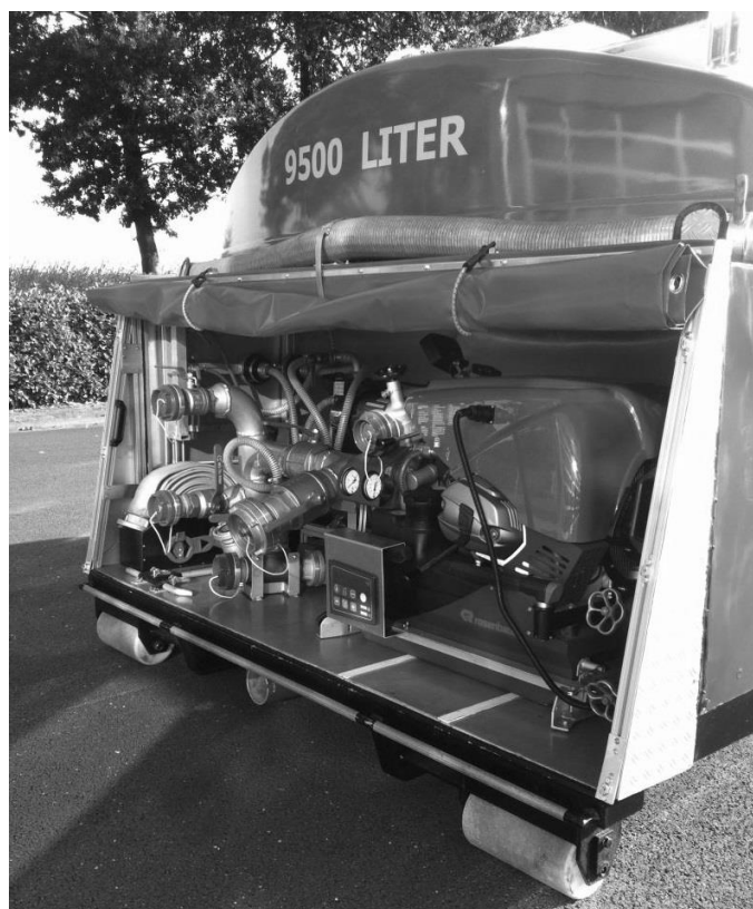
Рисунок 2 – Цистерна на платформі з автономною насосною установкою.

Таким чином, запропонований в цій роботі спосіб доставки води дозволяє реалізувати безперебійне її постачання до місця гасіння пожеж за умов руйнування насосних станцій та неможливості використання через це систем внутрішнього та зовнішнього протипожежних водопроводів. Реалізація цього способу потребує попереднього визначення місць розміщення автономних насосних станцій з кузовами-цистернами, а також їх кількості і чисельності вантажних автомобілів, які обладнані навантажувально-розвантажувальним механізмом гакового типу.