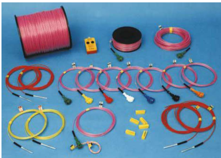
Рисунок 1 – Елементи неелектричної системи ініціювання «Нонель»

Переваги НЕСІ «Нонель»: несприйнятливість до дії блукаючих струмів, електростатичних зарядів і електромагнітних полів у діапазоні різних частот; підвищення продуктивності внаслідок прискорення підготовки вибуху; зниження вартості підривних робіт та висока надійність елементів системи.