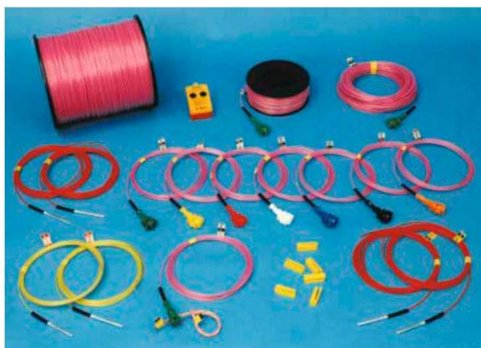
Рис. 1. Елементи неелектричної системи ініціювання «Нонель»

Одною з таких систем ініціювання є система «Нонель» (рис. 1) виробництва шведської компанії «DYNO NOBEL» призначена для відкритих і підземних підризних робіт, дозволяє створювати схеми підризу зарядів з практично необмеженими можливостями управління процесами підризу.