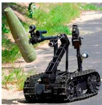
Рис. 1. Роботизована система «TALON»

Згідно із [1], в нашій державі активно розвивається система гуманітарного розмінування. Як доводить аналіз виконання робіт з гуманітарного розмінування на території України урядовими організаціями та міжнародними операторами, ці роботи в основному здійснюються ручними методами, однак міжнародний досвід підтверджує необхідність створення технічних засобів, зокрема робототехнічних систем та комплексів (РТСК) військового (подвійного) призначення, включаючи РТСК для проведення гуманітарного розмінування. В Україні та світі проведено ряд досліджень теоретичного та експериментального характеру, в результаті яких розроблені дослідні зразки таких РТСК, в тому числі і для проведення гуманітарного розмінування [2]. Більшість країн світу, активно розробляють РТСК, які здатні з високим ступенем автономності здійснювати пошук, ідентифікацію та знищення ВВП й СВП без участі людини рис. 1 та 2.