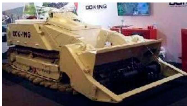
Рис. 2. Машина для розмінування з дистанційним керуванням MV-4