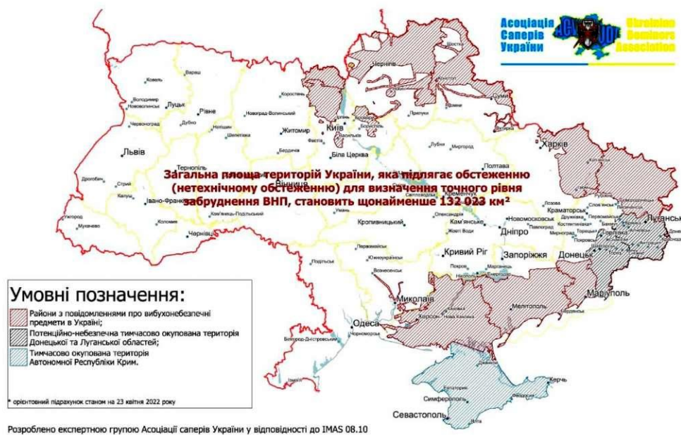
Рис. 1. Потенційно-небезпечні території України, які можуть містити ВНП, як наслідок широкомасштабної агресії з боку рф, на яких існує нагальна потреба у проведенні гуманітарного розмінування

За попередніми оцінками ДСНС України загальна площа територій, що підлягають обстеженню на наявність ВНП та розмінуванню складає близько 300 тис. км 2 , а за підрахунками неурядової організації – Асоціації саперів України – ці території (станом на квітень 2022 року) склали понад 132 тис. км 2 рис. 1.