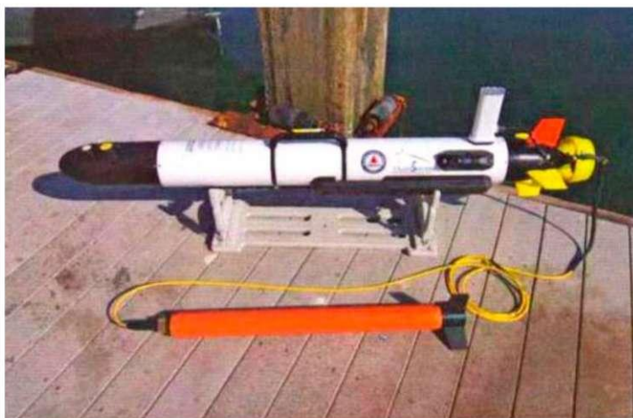
Рис. 1. AUV Iver 3 з магнітометром Marine Magentics

Після того, як підводні ділянки ВЗВ охарактеризовані та встановлена їх пріоритетність у ході нетехнічного обстеження, має бути проведене підводне технічне обстеження. Основний інструментарій, наявний для проведення обстежень у сучасних комерційних технологіях, складається з акустичних сонар-систем, магнітометрів та оптичних засобів, варіант яких наведений на рис. 1.