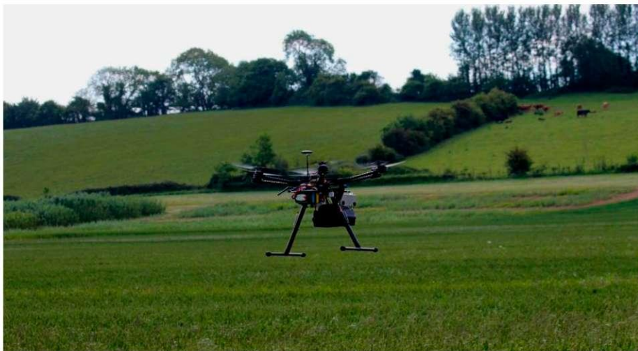
Рис. 1. Використання дрону для виконання робіт з очищення місцевості від вибухонебезпечних предметів

На даний час в світі набирає оберти один із напрямів виконання робіт у сфері протимінної діяльності, що стосується розмінування мінних полів за допомогою безпілотних літальних апаратів (дронів, роботів) рис. 1.