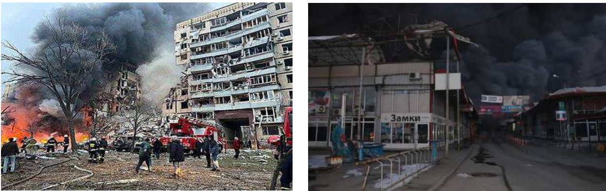
Рис. 1. Наслідки ракетно-артилерійських обстрілів України.

З початку повномасштабної війни протягом 2022 року під час виконання завдань за призначенням загинуло понад 50 рятувальників. Кількість травмованих рятувальників обчислюється сотнями [1]. При цьому слід зауважити, що виконання бойових завдань в умовах бойових дій суттєво відрізняються із впливом багатьох факторів. На початку повномасштабного вторгнення кількість виїздів не рахували вже й самі рятувальники. Змінювалися адреси, особовий склад перенаправлявся з місця на місце, масштабні руйнування супроводжувалися пожежами, в той час як і без того складна обстановка ускладнювалась постійною загрозою повторних обстрілів (Рис.1). Таким чином однією з основних причин травмування та загибелі рятувальників стала загроза ураження внаслідок ракетно-артилерійських обстрілів [2].