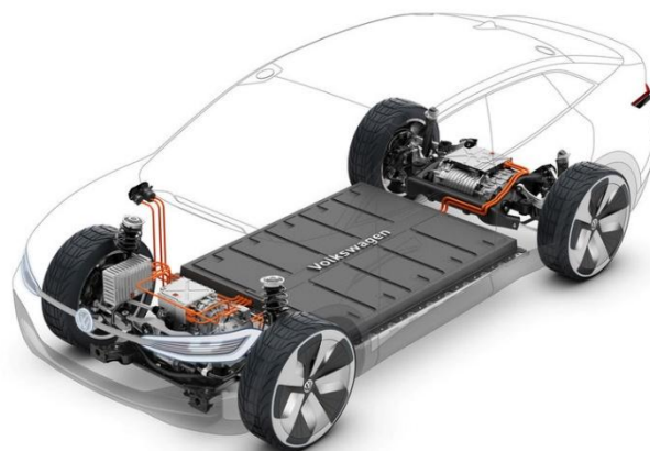
Рисунок 3 – Схема розташування акумуляторних батарей в електромобілі

Повномасштабними дослідженням по гасіння акумуляторних батарей електрокарів встановлено, що середня кількість води необхідна для гасіння коливається від 2,5 до 6 м 3 , що може перевищувати об'єм цистерни пожежного автомобіля [1,2]. Збивати вогонь на електрокарах традиційними методами не можна, є загроза вибуху. Тому у багатьох країнах існує правило: якщо в палаючому авто немає людей, дочекатися, повного вигорання. Труднощі гасіння пов'язані з розташуванням акумуляторних батарей (рис.3).