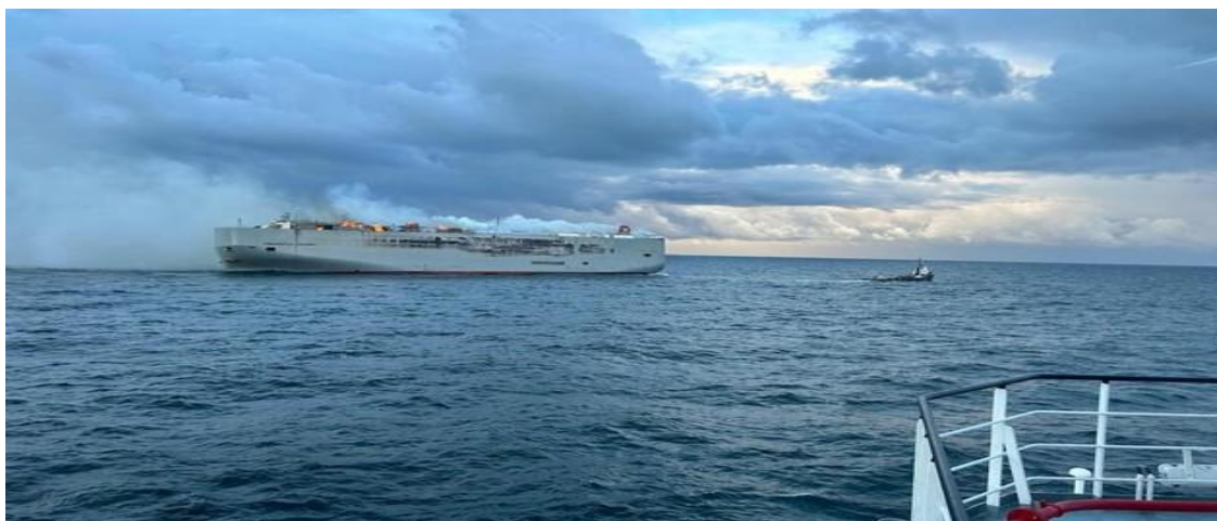
Рисунок 1 – Пожежа на судні «Fremantle Highway»

У світі сучасних технологій ми все більше зустрічаємося з таким видом транспорту, як електромобілі. Це пов'язано з економічністю та комфортом. Але двигуни з літійонними акумуляторами можуть загорятися не гірше чим бензинові або дизельні двигуни. Отримані результати досліджень показують, що елементарний літійонний елемент живлення під час горіння здатний продукувати від 6 до 10 кВт енергії. Прикладом масштабної пожежі є загоряння 25 липня 2023 року на вантажному судні «Fremantle Highway» біля північного узбережжя Нідерландів, що перевозило 2857 автомобілів, пожежа виникнула у одному із 25 електромобілів (рис.1).