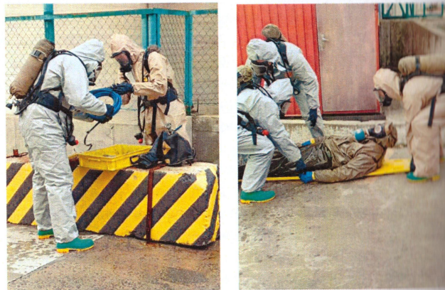
Рис. 2 – Практика курсантів 3-го курсу на посаді начальника відділення радіаційної та хімічної розвідки групи РХБ захисту

Кафедра здійснює також підвищення кваліфікації та спеціалізацію за напрямом РХБ-захисту для начальників служб (секторів) радіаційного, хімічного та медико-біологічного захисту, начальників караулів ДПРЧ, начальників хіміко-радіометричних лабораторій ДСНС України, інженерів з радіаційної безпеки; інженерів з радіаційної та хімічної розвідки.