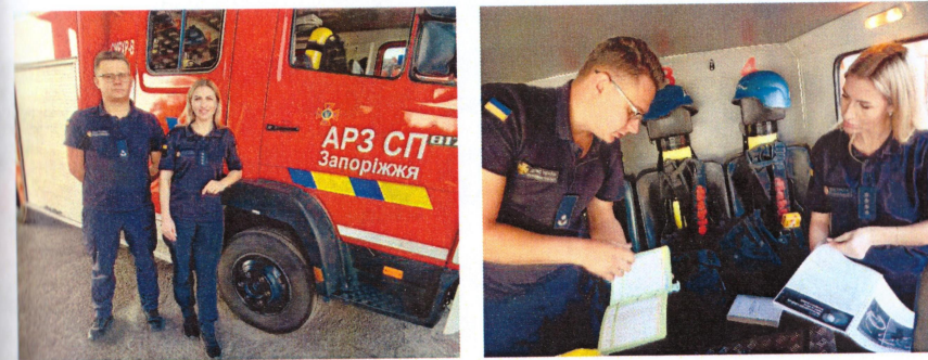
Рис. 4 – З 02 по 06 жовтня 2023 року тривало відрядження до ГУ ДСНС України у Запорізькій області представників НУЦЗ України

Розроблена на кафедрі система навчальних курсів працює на випередження, оскільки розвиває грамотного фахівця-хіміка зі специфікою протидії надзвичайним ситуаціям, що необхідно в більшості галузей промисловості. Це й аварійні розливи хімічно активних речовин, і утворення вибухонебезпечних сере-