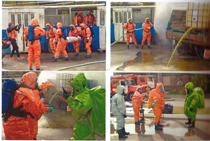
Рис. 7 – Протягом триденного тренінгу понад 40 фахівців підрозділів ДСНС з радіаційного, хімічного та біологічного захисту були учасниками соціально-психологічного тренінгу «Відпрацювання технік взаємодії з постраждалими з різними психологічними моделями поведінки внаслідок надзвичайних ситуацій, пов'язаних із небезпечними хімічними речовинами»

Місії США в ОБСЄ та Федерального міністерства закордонних справ Німеччини у взаємодії з Міністерством внутрішніх справ України та Державною службою України з надзвичайних ситуацій курсанти НУЦЗ України та фахівці підрозділів ДСНС з радіаційного, хімічного та біологічного захисту відпрацьовували дії пожежно-рятувальних підрозділів під час реагування на інцидент із небезпечною хімічною речовиною, включаючи евакуацію потерпілих, блокування витоку речовини, знешкодження персоналу та цивільного населення.