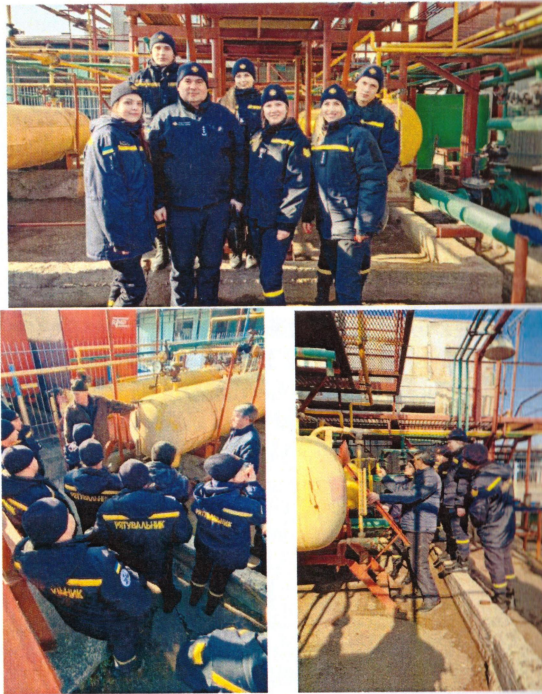
Рис. 1 – Війське заняття на території підприємства «База ОПС–Черкаси гараж»