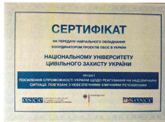
Рис. 6 – У рамках проекту міжнародної технічної допомоги представники ОБСЄ в Україні передали до Національного університету цивільного захисту України спеціальне навчальне обладнання для відпрацювання навичок роботи рятувальників під час ліквідації надзвичайних ситуацій з викидом небезпечних хімічних речовин

Для посилення спроможності Державної служби України з надзвичайних ситуацій (ДСНС) готувати рятувальників, задіяних у реагуванні на надзвичайні ситуації хімічного характеру, Координатором проектів ОБСЄ в Україні розроблено Рекомендації до розроблення модульної навчальної програми для осіб молодшого, середнього та старшого начальницького складу ДСНС, які беруть участь в реагуванні на події, пов'язані з небезпечними хімічними, радіоактивними і біологічними речовинами (РХБ), надано обладнання для проведення практичних навчань, організовано ряд інтенсивних теоретичних та практичних тренінгів для співробітників спеціалізованих РХБ підрозділів ДСНС, де науково-педагогічний склад кафедри брав безпосередню участь.