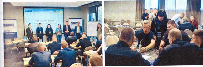
Рис. 3 – Тренінг з основ реагування на радіаційні загрози для профільних співробітників ДСНС та ДПСУ в межах проєкту «Посилення спроможності України щодо реагування на надзвичайні ситуації, пов’язані з небезпечними хімічними речовинами»

Якість освіти на кафедрі забезпечується висококваліфікованим науково-педагогічним персоналом, який постійно підвищує свою кваліфікацію, бере участь у спільних навчаннях з фахівцями країн Європейського союзу, співпрацює із практичними підрозділами та стейкхолдерами, а також виступають учасниками тренінгів, організованих у межах реалізації Програми підтримки ОБСЄ для України.