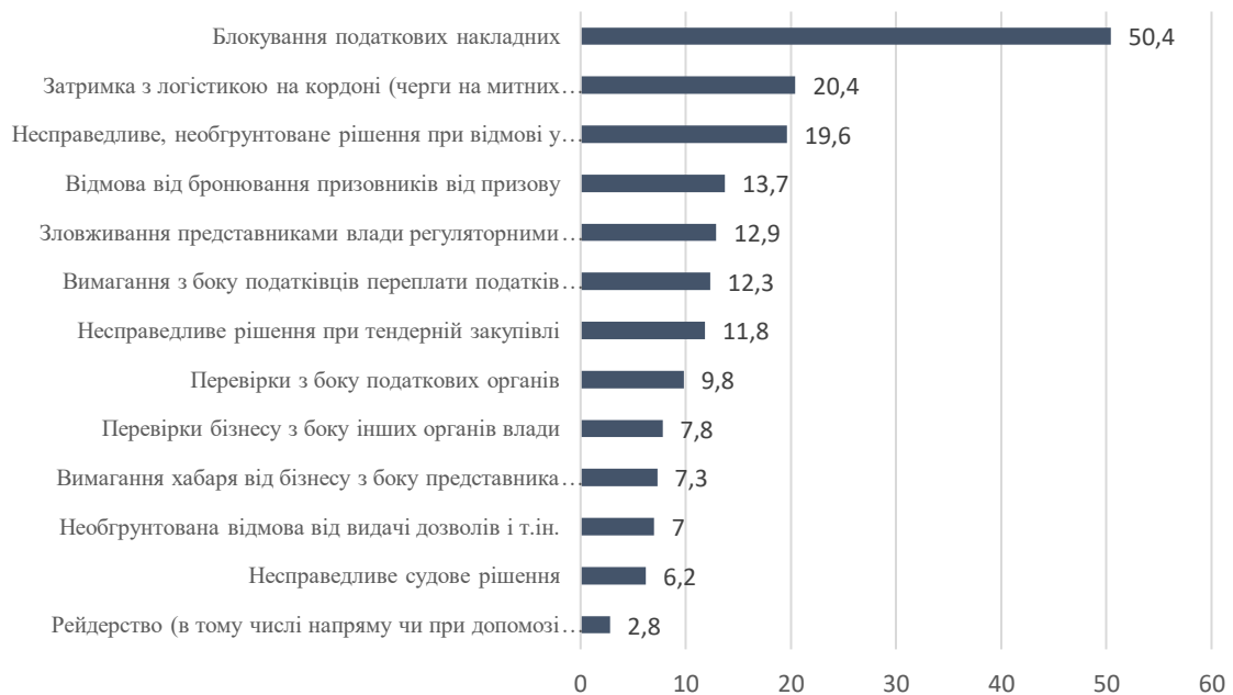
Рис.1. Проблеми бізнесу у взаємовідносинах з органами влади, %

Виявлено найбільшу проблему бізнесу у тому, що податкова служба блокує податкові накладні, а саме із 504 опитаних, так вважає половина респондентів (50,4%). Це призводить до неможливості здійснювати нормально діяльність малого бізнесу. Податківці не обґрунтовують свої рішення, «Чинний порядок блокування ПН/РК значно сповільнює бізнес, а недотримання регіональними податківцями їхніх обов'язків щодо обґрунтування причин блокування ПН/РК та неврахування Таблиці даних призводить до втрат бізнесом часу, грошей та репутації» [1].