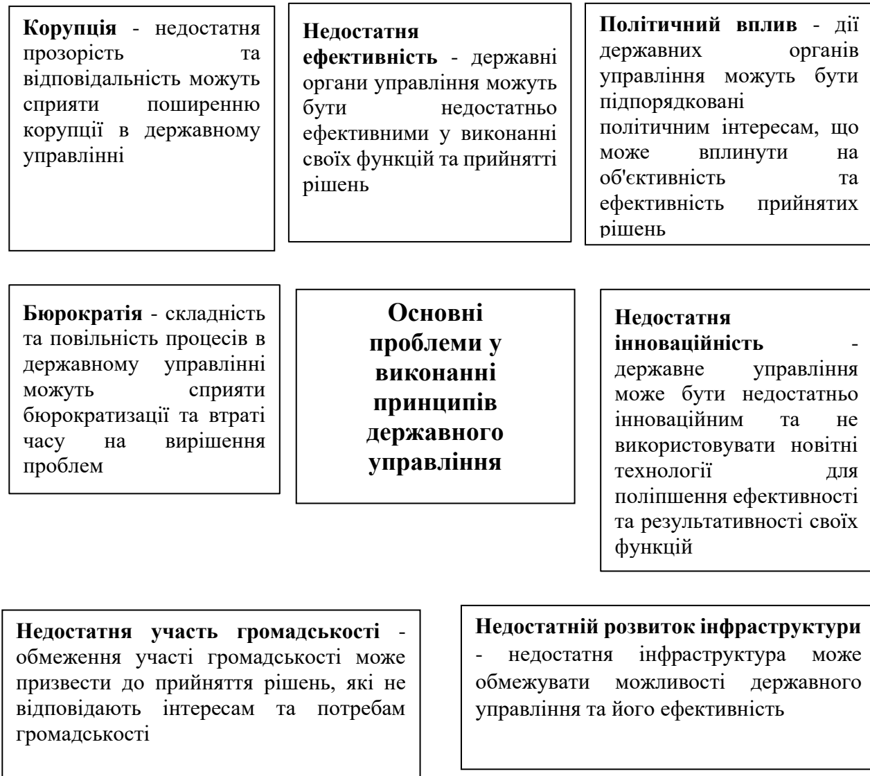
Рисунок 1 - Основні проблеми у виконанні принципів державного управління [2]

Враховуючи ці проблеми, державні органи управління повинні розробляти та впроваджувати стратегії та політики, що спрямовані на вирішення вищезгаданих проблем. Наприклад, держава може зміцнювати прозорість та відповідальність в державному управлінні шляхом створення механізмів контролю та звітності, забезпечувати навчання та професійний розвиток державних службовців, прискорювати процеси вирішення питань, поліпшувати комунікацію з громадськістю та використовувати новітні технології. Також можливими заходами можуть бути зміцнення незалежності державних органів управління, забезпечення їх фінансування та розвитку інфраструктури. В цілому, метою таких стратегій є забезпечення більш ефективного та стабільного державного управління, яке сприятиме сталому розвитку країни [4].