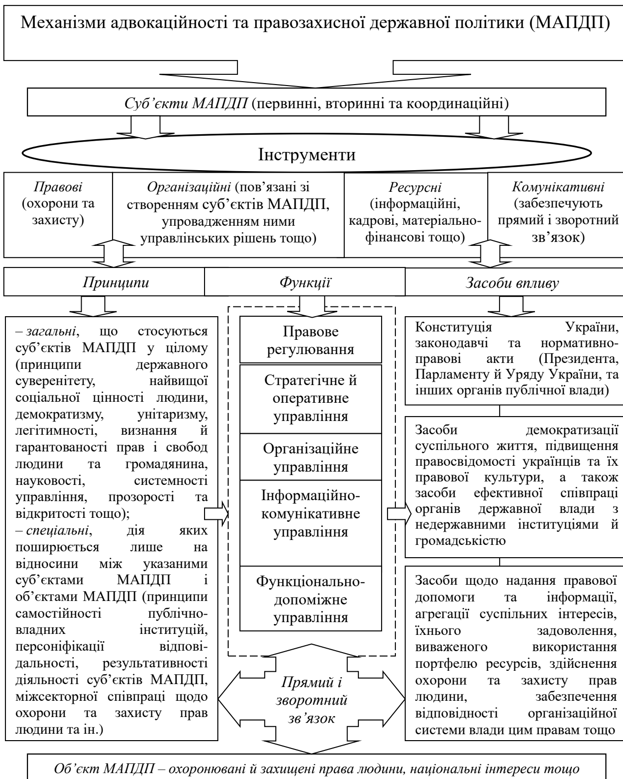
Рис. 1. Структура механізмів адвокаційності та правозахисної державної політики

інструменти, методи, засоби та форми (рис. 1).