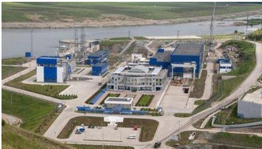
Рис. 1. Типова ГАЕС на території України.

З врахуванням росту інтересу до відновлювальних джерел енергії та зменшення використання вугільних та інших видів енергетичних джерел, гідроаккумулятивні електростанції (ГАЕС) стають ще більш актуальними. Вони виступають важливим елементом переходу до енергетичної системи з низьким рівнем викидів вуглецю та сприяють забезпеченню стійкості та безпеки електропостачання (рис. 1).