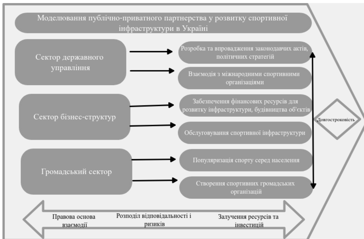
Рис. 2 Моделювання публічно-приватного партнерства у розвитку та оновленні спортивної інфраструктури в Україні

Держава отримує доступ до необхідних ресурсів та експертизи, а приватний сектор отримує можливість отримувати прибуток від інвестицій у спортивну інфраструктуру. Ризики, пов'язані з проектом публічно-приватного партнерства, мають бути справедливо розподілені між державою та приватним сектором. Проекти публічно-приватного партнерства мають бути спрямовані на сталий розвиток спортивної інфраструктури та довгострокову підтримку потреб населення. Публічно-приватне партнерство у сфері спорту може бути реалізовано у таких формах як: концесії, лізинг, спільні підприємства. Моделювання принципів засад організації публічно-приватного партнерства у розвитку спортивної інфраструктури відображено на блок-схемі (рис. 2).