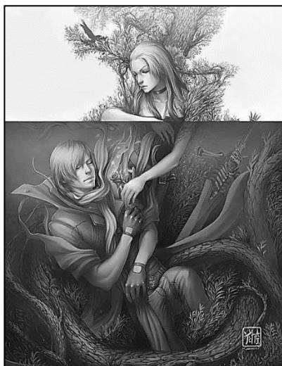
Рис. 4. В. і М. Ременар. Моя троянда.

П.: 91 Якщо це так, то на малюнку «Тату вини» агресії вистачить і на хлопчика (див. рис. 3). Ні губ, ні дихання немає, що може бути самопокаранням за те, що ти не хлопчик , адже ніс – фалічний символ. Базальна архаїчність цієї вини, ще