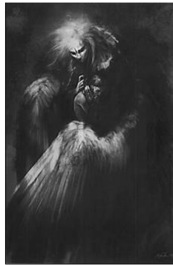
Рис. 5. В. К. Салонен. Хороша мрія.

М.: 92 У комплексі моїх психомалюнків хлопчики з дівчатками не відрізняються один від одного, хіба