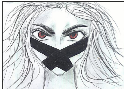
Рис. 3. Тату вини.

означає прощання з тим образом хлопчика, якого чекали замість мене. Мама дуже сильно хотіла, щоб народився хлопчик, і назвати його в честь батька, а народилася я.