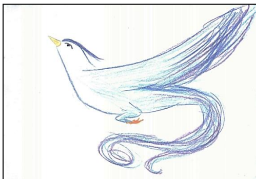
Рис. 2. Власне тату.

М.: 90 Я підбрала репродукції до малюнку «Власне тату» (див. рис. 2). Цей малюнок (див. рис. 4) для мене