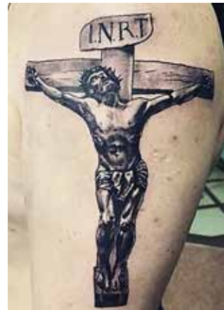
Рис. 4. Тату «Розп'яття Ісуса Христа». Майстер О. Руденко