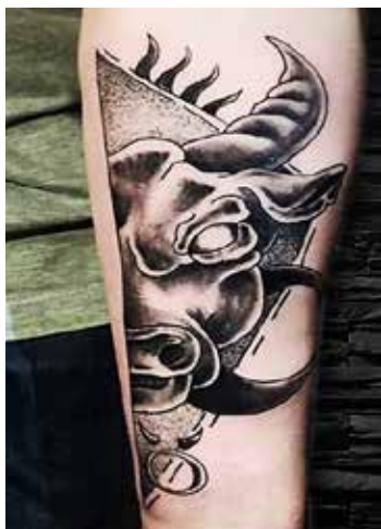
Рис. 1. Тату «Бик». Майстер Є. Сухов

Різноманітність і розповсюдженість татувань потребує умовного поділу їх на групи за різними