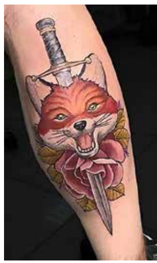
Рис. 8. «Лисиця». Майстер А. Цвигун