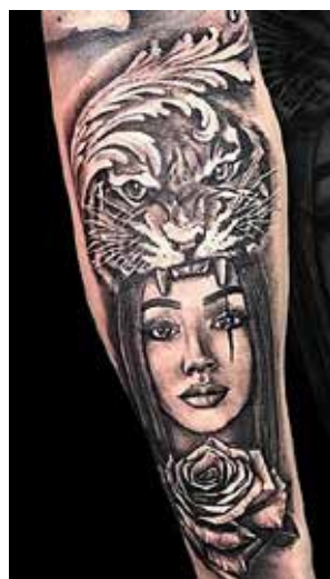
Рис. 9. «Тигр і дівчина». Майстер А. Кеваркова