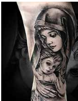
Рис. 5. Тату «Богородиця з Ісусом». Майстер С. Хандубей