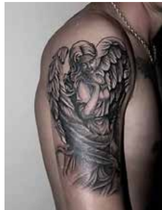
Рис. 6. Тату «Янгол». Майстер Ю. Віноградова