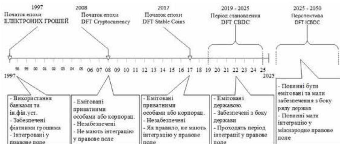
Мал.1 – Генезис цифрових фінансових технологій

6 етап – смарт- карти з мікропроцесорним чипом який забезпечує підвищений рівень захисту;