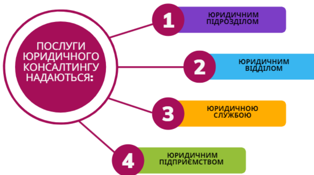
Рис. 1. Організаційні форми надання юридичного консалтингу.

Юридичний консалтинг – це професійна діяльність фахівців з різних галузей права, метою якої є надання у консультаційній формі кваліфікованої допомоги фізичним і юридичним особам у вирішенні різноманітних правових питань шляхом правових порад, забезпечення необхідною правовою інформацією і вибору оптимального варіанта вирішення проблеми [1, с. 4]. Головними видами юридичного консалтингу є надання: – юридичних послуг, тобто функцій, змістом яких є виконання фахівцями з права певних професійних функцій та дій юристів за замовленням клієнтів представлення інтересів клієнтів у державних та недержавних закладах, складання договорів, претензії, позик тощо); – юридичних послуг консультативного типу (надання клієнтам професійних порад, рекомендацій, пропозицій стосовно вирішення їх проблем юридичного характеру) [1, с. 22]. Організаційні форми надання юридичного консалтингу показано на рисунку 1.