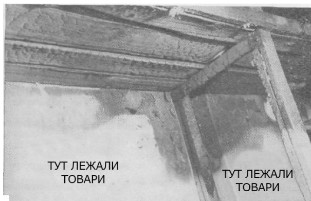
Рис. 1. Стан стіни свідчить про те, що під час пожежі на полицях знаходилися товари, які горіли, прикриваючи одночасно ділянки стіни від дії високої температури

дії полум'я та високої температури складеними предметами, зберігаються краще, ніж відкриті. На них можуть утворитися свого роду відбитки предметів, шматків тканин, стосів білизни і т. ін. Вищерозташовані ділянки стін, перекриттів, стелажів можуть мати більш виразні місцеві руйнування як результат горіння відповідних матеріалів в цьому місці. Звичайно, такі спостереження можуть бути зроблені в тому випадку, якщо руйнування відносно невеликі та стан конструкцій приміщення, в якому виникла пожежа, дозволяє співставляти наслідки пожежі на різних ділянках (рис. 1).