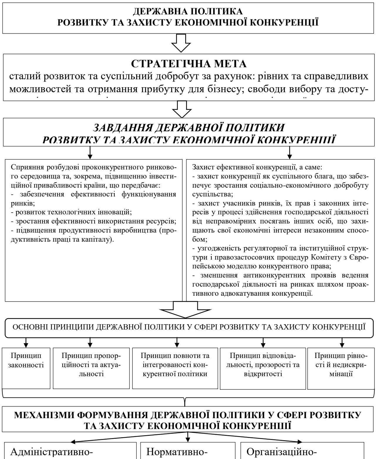
Рис. 2. Концептуальна модель державної політики розвитку та захисту економічної конкуренції в Україні

Таким чином, розробка концептуальної моделі державної політики розвитку та захисту економічної конкуренції в Україні показує те, що держава