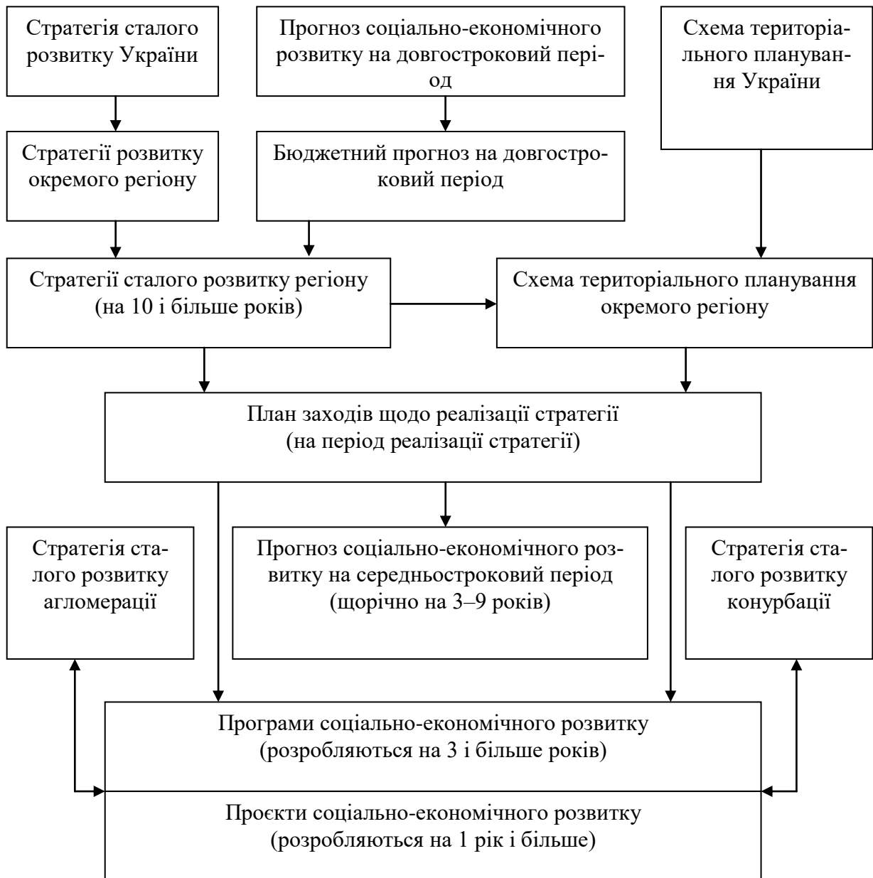
Рис. 2. Система стратегічного та оперативного планування міських агломерацій зокрема та в Україні загалом Джерело: складено на підставі [8; 10]

ключну роль. Хоча на практиці може бути все навпаки: потужні об'єднані громади стають ще більш конкурентними акторами, а великі міста – не зацікавленими в агломераційних процесах. Дана проблема є актуальною для України, свідченням чого є диспропорції у розвитку її громад і територій. Крім того, складності додає правова норма аналізованої стратегії щодо «територій сталого розвитку», зокрема, не зрозуміло, чому ці території не розглядаються нормо твоями в межах міських агломерацій, а якось відірвано від загального контексту.