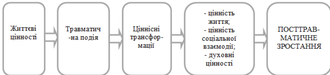
Рис. 1. Трансформація життєвих цінностей особистості в контексті посттравматичного зростання

Існують загальні особливості процесу трансформації життєвих цінностей особистості, які визначають значення феномену посттравматичного зростання. Таким чином можна припустити, що трансформація особистісних цінностей в контексті посттравматичного зростання має певні вектори становлення та розвитку. А саме: від базових цінностей в дотравматичний період до активізації механізмів особистісного зростання в посттравматичний період (рис. 1).