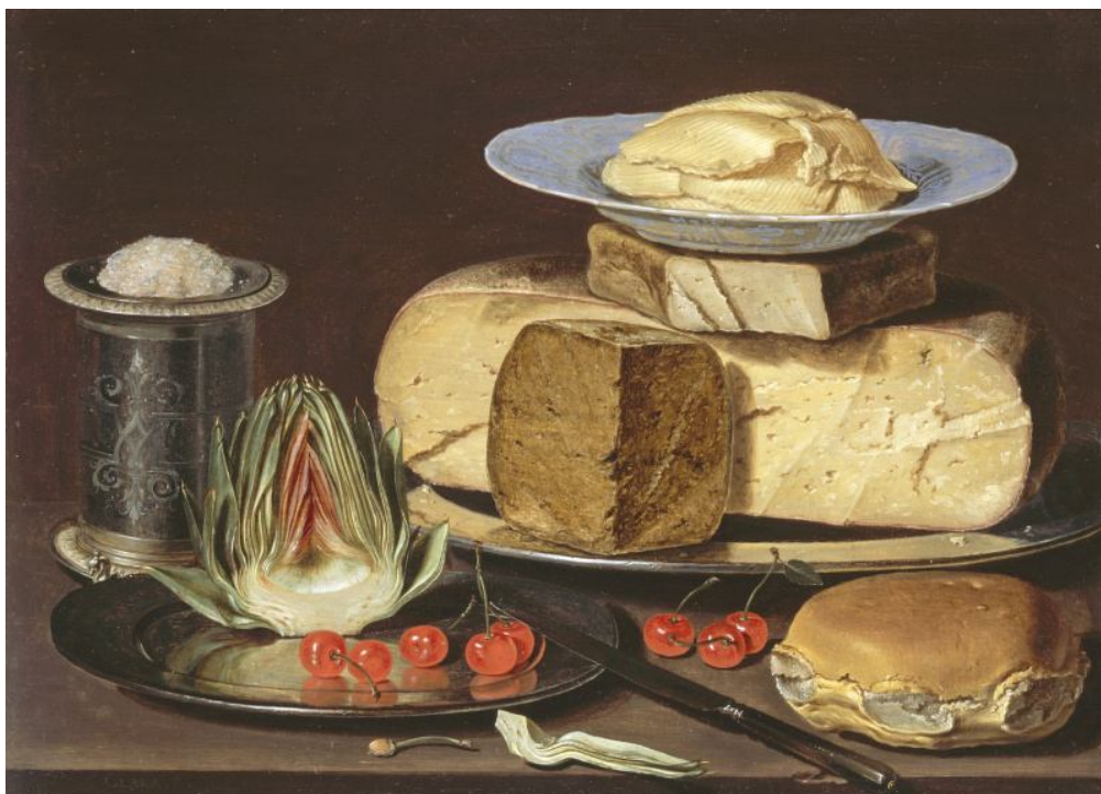
Рис. 9. Клара Петерс. «Натюрморт з сиром, артишоком та черешнею» (бл. 1615 р.)

Умовно цей жанр натюрморту отримав назву «сніданку». Однак їжа на столі ніяк не була прив'язана до часу дня та її прийому. Це могли бути й обіди, вечери, а також і сніданки. Щоб натюрморт виглядав цікавим та живим, а не просто зображав купу різних предметів, від художника ще вимагалось ретельно продумати композицію. Тому картини «сніданків» мають якусь інтимність, мов би глядачі випадково заглянули в чийсь домівок або в чийсь життя.