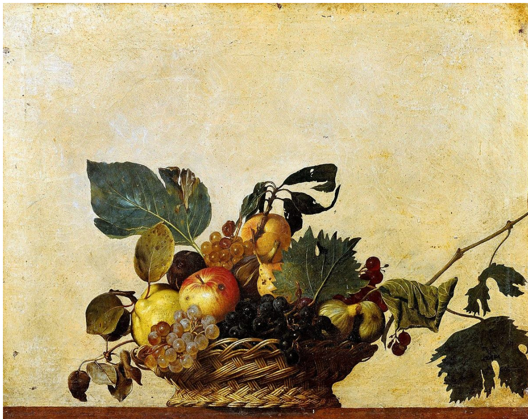
Рис. 4. Караваджо. «Кошик з фруктами» (1596)

Як бачимо, визначитися з першістю досить важко, а першого творця натюрморту визначають у залежності від вподобань дослідників-мистецтвознавців. Крім того, участь у цій «боротьбі» беруть музеї. Так, Стара Мюнхенська Пінакотека, яка є щасливим володарем натюрморту Якопо де Барбарі, наголошує, що саме він є першим художником, який створив натюрморт без будь-якого релігійного підтексту. В той час, як Міланська Пінакотека, природно, вважає засновником європейського натюрморту Караваджо, бо його «Кошик з фруктами» знаходиться саме в цьому музеї. Автор статті дотримується точку зору, що саме Якопо де Барбарі необхідно вважати митцем, що створив перший в Європі натюрморт, бо саме він зовсім позбавлений будь-яких релігійних асоціацій і з'явився значно раніше полотна Караваджо.