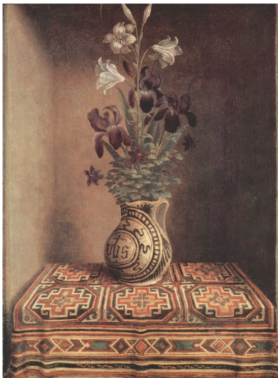
Рис. 1. Ганс Мемлінг. «Квіти у візі» (1485)

лілії символізують її чистоту, іриси та аквілегії – символ Цариці Небесної та Святого Духу, перемоги життя над смертю. Навіть килимок, на якому стоять квіти, має зображення хреста. Тобто це не просто квітковий натюрморт – це прояв релігійного живопису. До того ж композицію було зображено на зворотному боці чоловічого портрета в маленькому триптиху, де в центрі зображено Марію з Немовлям, а з боків портрети подружжя донаторів. Цей портрет має ще й другу назву «Молитва». Тепер стає зрозумілим, до кого саме звернута ця молитва.