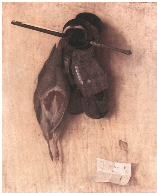
Рис. 2. Якопо де Барбарі. «Натюрморт з куріпкою, залізними рукавицями та арбалетною стрілою» (1504)

Ідея натюрмортних зображень сподобалася та найшла своє продовження в середині XVI ст. у роботах різних живописців. Так, у 1551 р. нідерландський художник Пітер Арстен пише свій «Стіл м'ясної крамниці». Тут зображено «м'ясну пишноту»: стіл просто завалено свинячими головами, сосисками, розчиненими тушами м'яса, окістами та різноманітними ковбасами. М'ясна різноманітність викликає справжнє захоплення. Вся увага глядачів прикута до цього багатства продуктів харчування. На перший погляд перед нами традиційні «лавки», які стали гімном добробуту, заможного та радісного життя. Але якщо розглядати картину більш уважно, то на задньому плані можна побачити нещасних, бідних, голодних людей, що просять милостиню і не мають ніякого відношення до буяння життя на першому плані картини. Арстен жив у часи Реформації, коли в протестантській