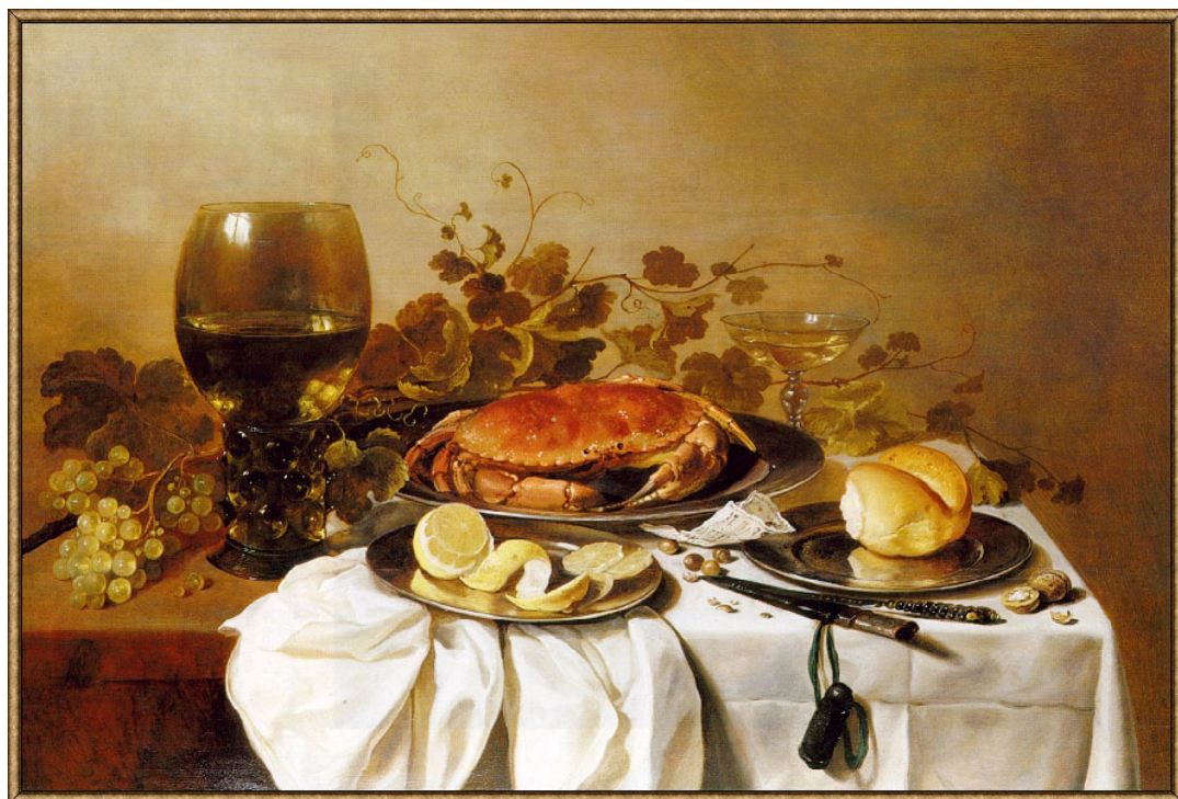
Рис. 8. Пітер Клас. «Натюрморт з крабом» (1643)

олов'яному посуді; келихи з пивом або вином тощо. Одним з неперевершених майстрів цього жанру був Пітер Клас, який зображував на полотні невелику кількість предметів, створюючи тим самим ілюзію скромної трапези на одну особу. Складається враження, що хтось щойно відійшов від накритого столу й ось-ось повернеться назад. Натюрморти Класа відрізняються ще й тим, що демонстрували об'ємне зображення, гру світла на предметах, відблиски, сріблястий тон тощо. Його пензлю також належали «Натюрморт з кубком та устрицями», «Натюрморт з оселедцем, вином та хлібом» (1647 р.), «Сніданок з рибою» (1653 р.) та інші. Практично на всіх них присутні особливі келихи – ремери. Це масивні скляні келихи зеленуватого кольору, з круглою верхньою частиною та довгою порожньою ніжкою, на якій були наліпки у вигляді ягід малини, крапель, бородавок та навіть жіночих грудей. Ці наліпки були потрібні для того, щоб келих гарно тримався та не прослизав у руці. Пили пива та вина в ті часи багато, а їли руками жирну їжу. Скляні вироби дуже слизькі, їх легко випустити та розбити. До того ж скло коштувало недешево, тож і були створені подібні наліпки. До речі, зображення скляного посуду на картинах символізувало достаток родини, а розбитий ремер – був символом крижкості людського життя та неминучості смерті. Перевернуті або розбиті скляні келихи дуже часто зустрічаються на полотнах Віллема Клас Хеди. Як бачимо, навіть в «сніданках» просліджуються філософські мотиви й атрибути натюрмортів «ванітас».