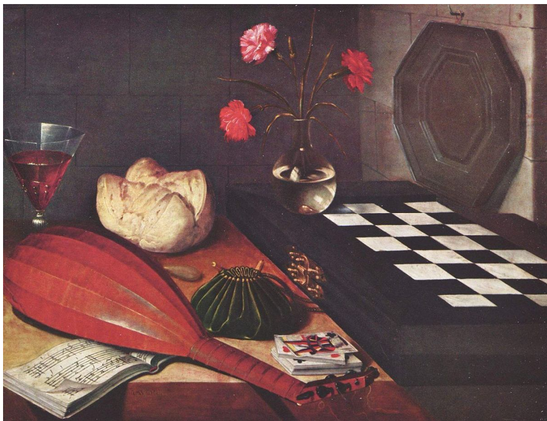
Рис. 7. Любен Божен «Натюрморт з шаховою дошкою» (близько 1630)

Леаль у своєму ванітас «В одну мить» (між 1670-1672 рр.). Це сцена триумфу Смерті в тлінному людському світі, коли вона виходить з косою на свої страшні жнива. Кістлявими ногами Смерть зневажає земну кулю та миттєво гасить свічку життя будь-кого зі смертних. Отже, натюрморти в жанрі ванітас були важливими моральними уроками для людей свого часу. Вони вимагали не просто роздивлятися намальоване, але й поміркувати про тлінність буття, про сенс свого життя тощо. На такі натюрморти не просто дивилися, їх читали, розгадуючи всі алегорії та приховані смисли.