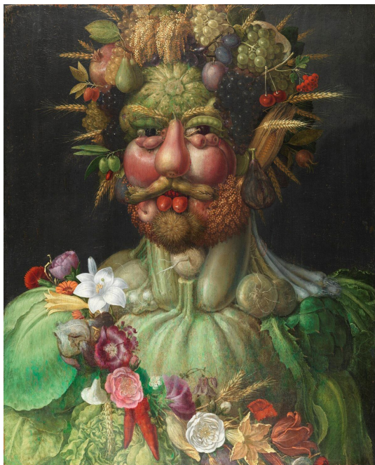
Рис. 3. Джузеппе Арчімбольдо. «Портрет Рудольфа II у вигляді бога садів Вертумна» (1590)

– це великий кабачок, брови – колосся з зерном, щоки – великі рожеві персики, губи – стручки гороху, а зачіска – з переплетіння спілих вишень, слив, винограду та листя. Осінь зображено у вигляді немолодого чоловіка з лисиною, яку уособлює гарбуз, вуха – у вигляді грибів, ніс – велика спіла груша і таке інше. А зиму зображено вже навіть і не людиною, а дерев'яним чудовиськом, пеньком в обрамленні осіннього листя. Ці несподівані натюрморти дуже цікаво роздивлятися та кожного разу знаходити щось нове.