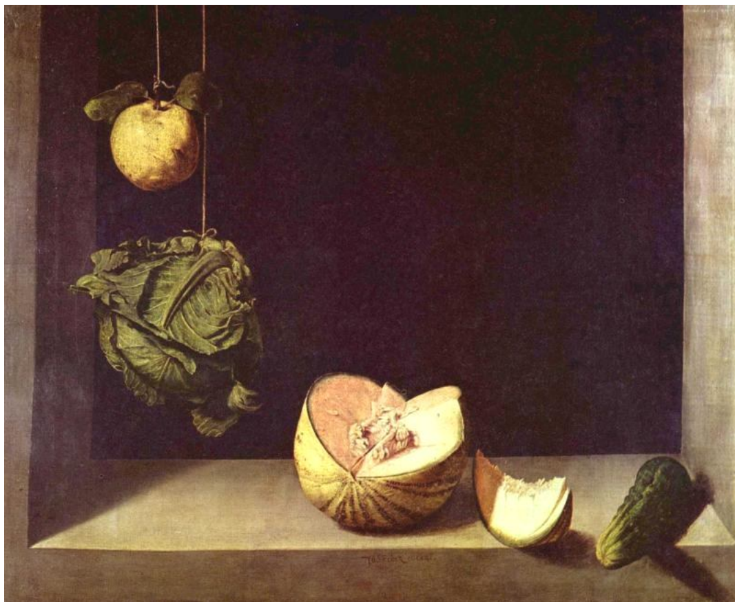
Рис. 10. Хуан Санчес Котан «Натюрморт з айвою, капустою, динею та огірком» (близько 1600 р.)

темному фоні, на кам'яній полиці у спеціальній ніші для зберігання сирих продуктів, розташованій в іспанських домівках між дверима. Котан часто зображував іспанський артишок – улюблений овоч бідняків. Кожний зображений предмет виглядає реальним і в той же час монументальним. Для Хуана Санчеса Котана притаманна містична відчуженість від мирської метушні та піднесена суворість.