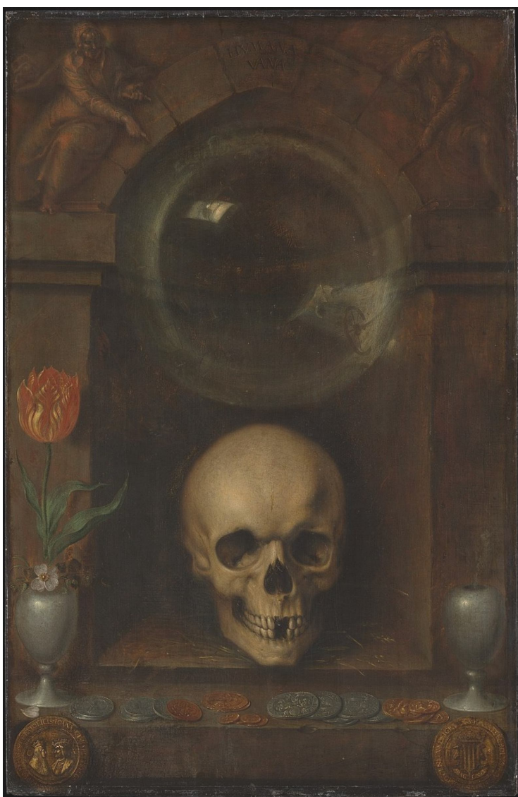
Рис. 6. Якоб де Гейн. «Ванітас» (1603)

оцінювалися в сотні і навіть в тисячі гульденів. Так почалася відома «тюльпанова лихоманка» або «тюльпанове безумство», коли всім хотілося мати тюльпанові цибулини або торгувати ними. Найрідкіснішими та найдорожчими з них були червоні з білими прожилками та червоно-жовті тюльпани. Цінувалися також бузкові та фіолетові з білими смужками. Саме такі зображено на картинах Амброзіуса Босгарта Старшого «Квіти у кошику» (1614 р.) з музею Гетті у Каліфорнії, «Квітковий натюрморт на вікні з дальнім пейзажем» (1620 р.) з Лувру, «Натюрморт з квітами» (1617 р.) зі Стокгольму, «Натюрморт з квітами» з Мюнхенської Пінакотеки та багато інших. Знаходимо такі рідкісні тюльпани в натюрморті Руланта Саверея «Натюрморт з квітів та двома ящірками» (1603 р.) з Утрехта, а особливо багато цього «тюльпанового безумства» в роботах Ханса Болоньера – фахівця квітового, а особливо тюльпанового натюрмарту з Харлема та багатьох, багатьох інших. На початку XVII ст. тюльпани стали втілюючою багатієм і символом високого статусу