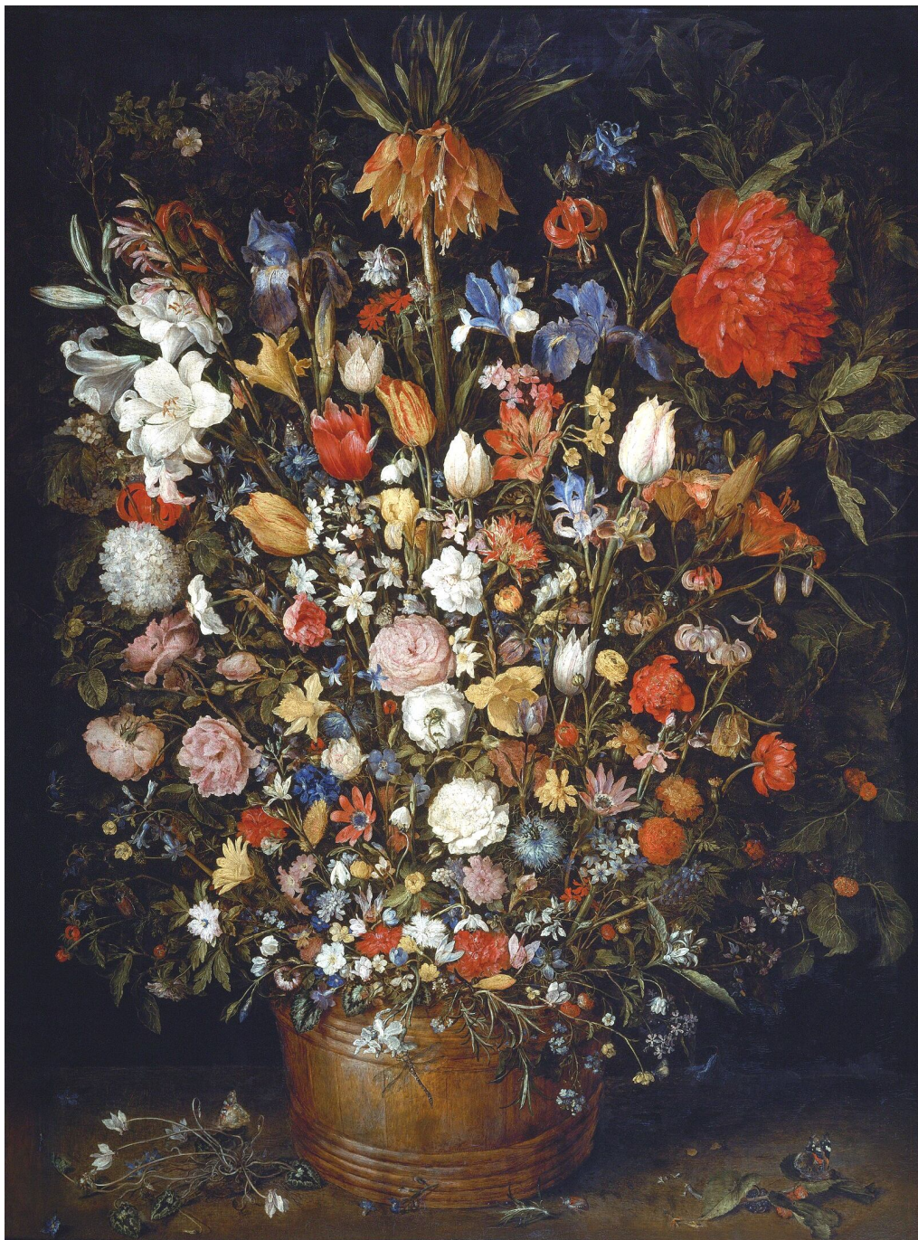
Рис. 5. Ян Брейгель-Старший. «Квіти в дерев'яній діжці» (1606)

Відомо, що жив він в Антверпені, але часто їздив до Брюсселя, в королівські оранжереї, до яких мав доступ. Художник міг місяцями чекати, коли розквітне та чи інша квітка, щоб замалювати її з натури, а потім використовувати ці малюнки у своїх натюрмортах.