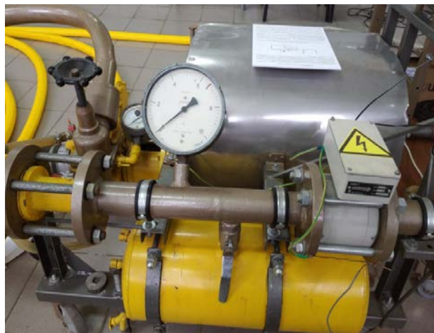
Рис. 1. Фото насосної установки

Моделлю трубопроводу слугували пожежні рукава довжиною 140 м, на яких спостерігаються явища, аналогічні звичайним трубопроводам, такі як втрати напору та гідродари [33]. Вода та водні розчини подавались насосом із ємності об'ємом 1 м 3 по рукавній лінії (внутрішній діаметр 125 мм) до ручного пожежного ствола РСК-50 (діаметр насадки 13 мм, кут факелу 30°, робочий тиск 3 bar). Насосна установка (рис.1) забезпечує контроль витрати та напору води. Асинхронний трифазний електричний двигун потужністю 18 кВт у поєднанні з відцентровим рідинним насосом дозволяє подавати воду з витратою до 48 м 3 /год при напорі до 1 МПа та проводити дослідження з різними типами ручного протипожежного обладнання. Керування електричним двигуном здійснюється за допомогою частотного перетворювача Danfoss VLT 6000 HVAC, що дозволяє підтримувати необхідне значення тиску рідини. Вимірювання тиску проводили за допомогою перетворювача тиску КРТ-Ех (межа вимірювання 2,5 МПа, клас точності 1). Витрату води визначали електромагнітним перетворювачем SDM 1022 (граничні відносні похибки при витраті від 0,65 м 3 /год ~ 2 %, клас точності 2), який працює у діапазоні витрат від 0,26 до 65 м 3 /год. Використана приладна техніка системи керування насосною установкою дозволила здійснити вимірювання основних параметрів потоку у живильному трубопроводі та визначити характеристики струменів, такі як коефіцієнти швидкості та витрати [33-34].