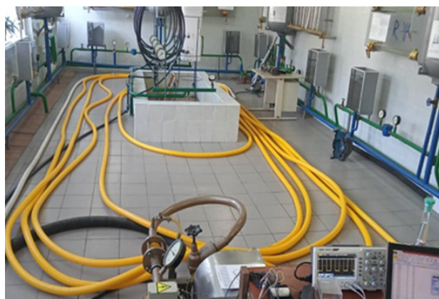
Рис. 2. Фото рукавній лінії L= 140м

Дослідження проводили у два етапи. На першому етапі визначали зміни витрати води та водних розчинів ПГМГ-ГХ за постійного значення тиску в рукавній лінії та різних концентраціях полімеру. Тиск контролювали за допомогою перетворювача тиску КРТ-Ех. На другому етапі досліджували вплив різних значень тиску в рукавній лінії на витрату води та водних розчинів ПГМГ-ГХ (рис. 2).