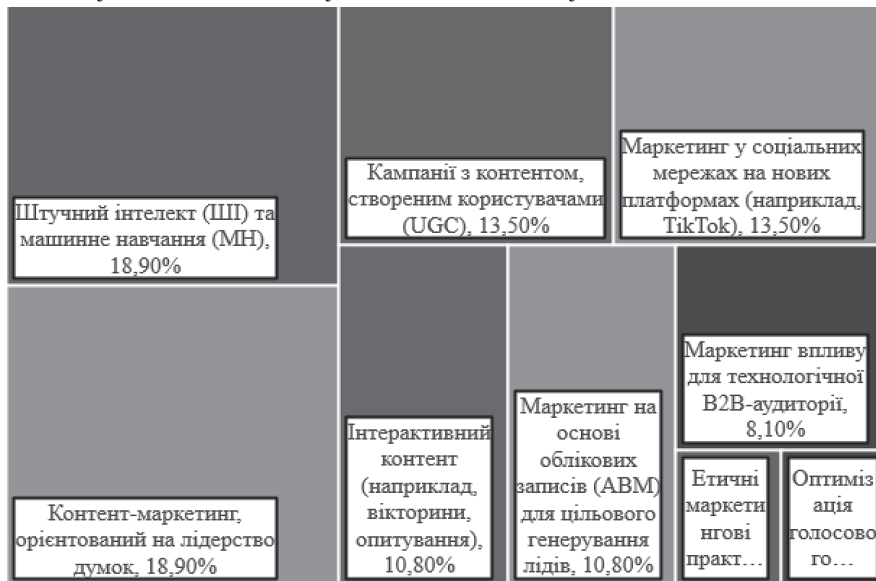
Найважливіші тенденції цифрового маркетингу, що змінюють ландшафт ІТ та технологій