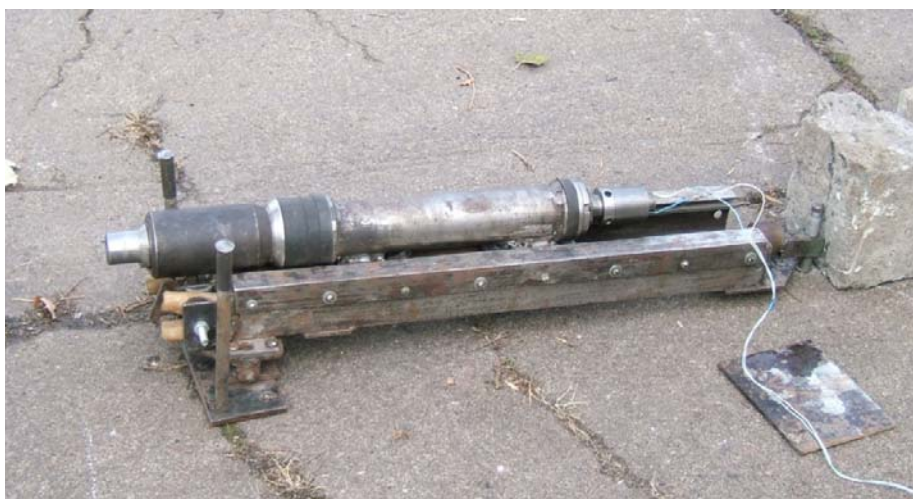
Рис. 1 – Экспериментальный образец водяной системы пожаротушения импульсного действия

Экспериментальные исследования проводились с помощью экспериментального образца водяной системы пожаротушения импульсного действия (ВСПИД) (рис. 1).