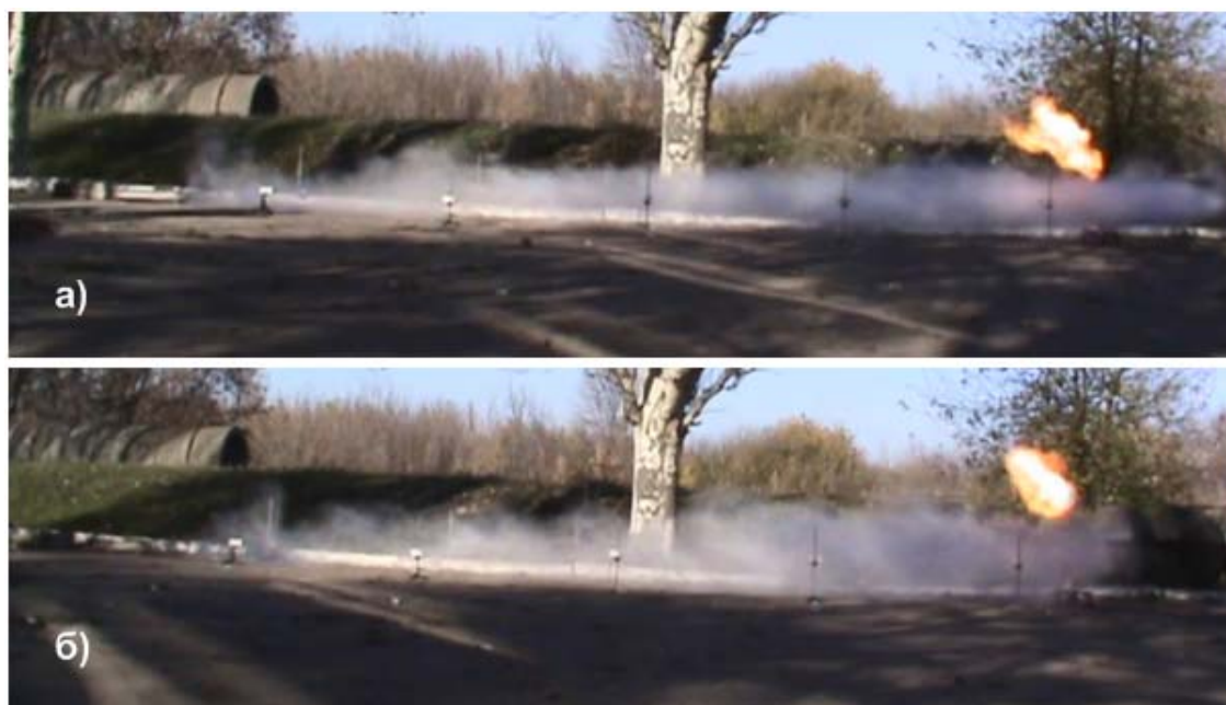
Рис. 3 – Фотографии полета струи огнетушащего вещества: а) вода; б) ФСГ-2

струи ФСГ-2 одинаковая и составляет 12 м. Это объясняется более высокой дисперсностью капель в струе ФСГ-2 в силу меньшего поверхностного натяжения, а также наличием в ее составе ингибирующих добавок.