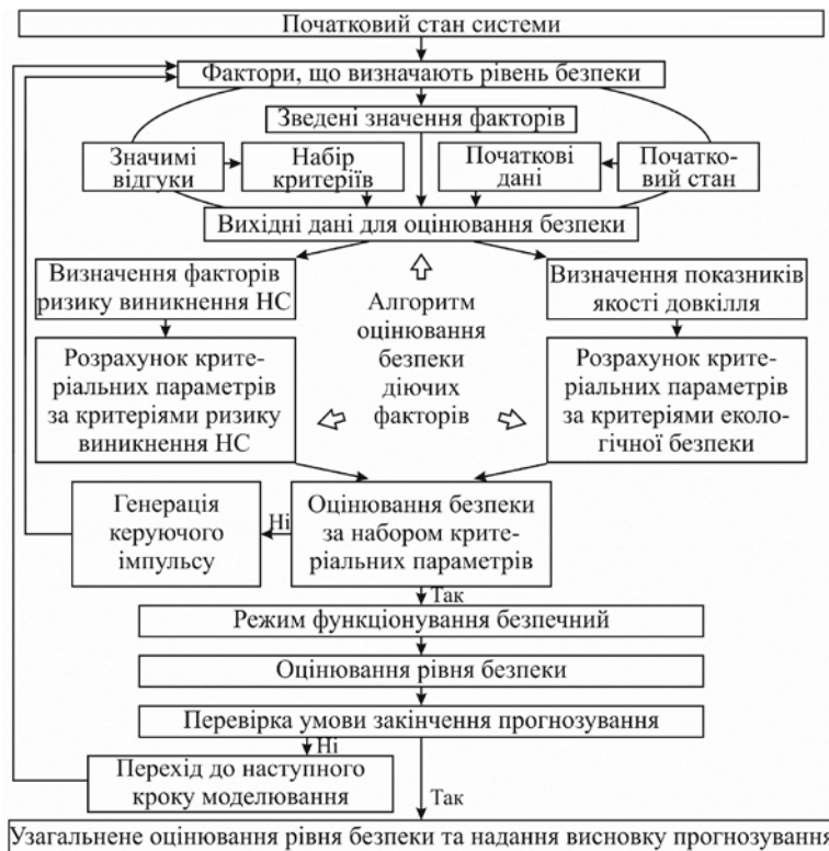
Рис. 2 – Спрощена схема методу прогнозування рівня безпеки полігону зі зберігання ТПВ

Оскільки реальні умови функціонування природних процесів у навколишньому природному середовищі характеризуються впливом складного комплексу негативних факторів, оцінювання результату їхньої дії має базуватися на сформованих динамічних моделях виникнення відгуків навколишнього середовища під дією тих або інших факторів. З урахуванням цього метод прогнозування рівня безпеки полігону зі зберігання ТПВ полягає у покроковій перевірці дотримання умов безпечного функціонування об'єкту на основі критеріїв безпеки у n -вимірному просторі факторів F_i \in \Phi , i = 1 \dots n , де n – кількість факторів у сукупності, які змінюються за програмою функціонування об'єкту, з наданням узагальненого висновку про рівень безпеки. Спрощену схему методу подано на рис. 2.