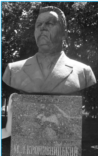
Світл. 3. Пам'ятник М. Л. Кропивницькому у дворі його будинку в Кіровограді (Кропивницькому)

Марко Лукич Кропивницький був похований у місті Харкові у 1910 році,