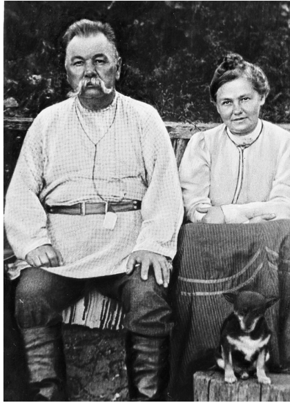
Світл. 2. Подружжя Кропивницьких у Затишці. Фото 1908 р.

Другий зал музею присвячений початку професійної акторської діяльності на вітчизняній сцені. У 1871 році митець вирушає до Одеси з метою продовження навчання. Там, зустрівши знайомих акторів, погодився зіграти роль Стецька у п'єсі «Сватання на Гончарівці». Після прем'єри, яка мала шалений успіх, йому запропонували професійний контракт, і Кропивницький погодився. В експозиції музею є одеські газети 1871 року зі схвальними рецензіями на гру молодого актора та фото Марка Лукича у ролі Стецька. Протягом 1871 – 1873 років Кропивницький поставив в Одесі