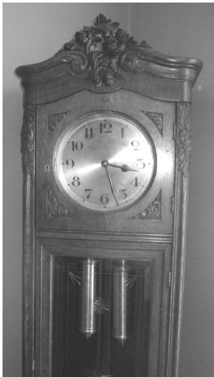
Світл. 1. Оригінальний годинник М. Л. Кропивницького, який стояв в його будинку в Кіровограді (Кропивницькому)

Марко Лукич Кропивницький народився 10 (22) травня 1840 року в селі Бежбайраки (тепер село Кропивницьке) Бобринецького повіту Херсонської губернії. Про це свідчить копія метричної книги Покровської церкви, знайдена в державному архіві Кіровоградської області. Однак сам митець у своїй автобіографії помилково зазначив іншу дату – 25 квітня. Як свідчить метрична книга, батько Марка Лукича Лука Іванович Кропивницький