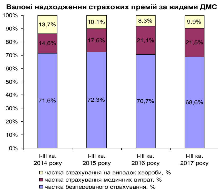
Рис. 2. Валові надходження страхових премій за видами державного медичного страхування (ДМС)

З метою визначення структури ринку добровільного медичного страхування проаналізуємо співвідношення окремих видів добровільного медичного страхування з огляду на показники валових страхових премій за останні роки (рис.2).