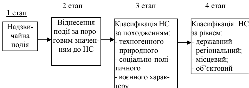
Рис 2. Послідовність класифікації надзвичайних ситуацій