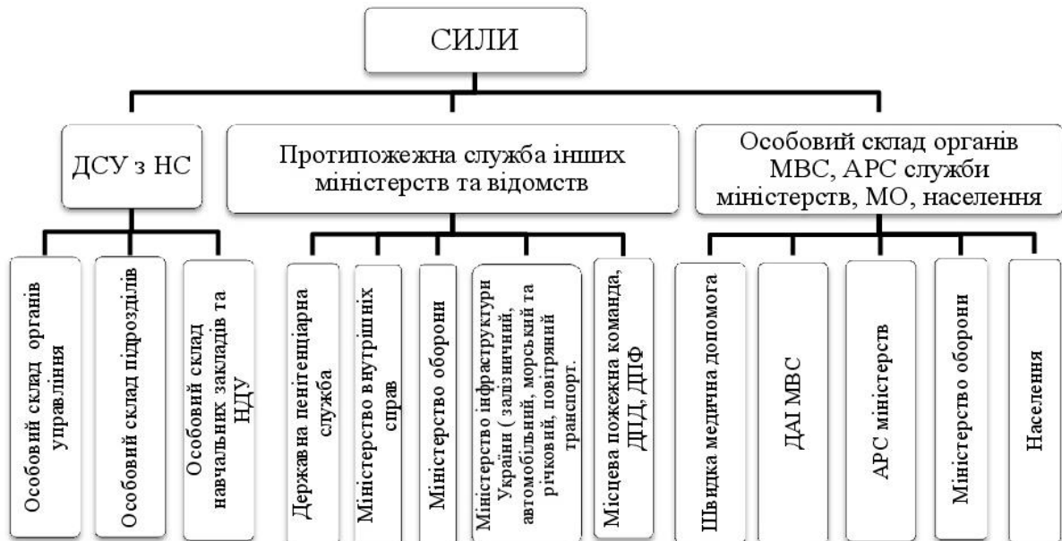
Рис. 1. Сили цивільного захисту

Для гасіння пожеж може залучатися у встановленому порядку особовий склад органів внутрішніх справ, аварійно-рятувальної служби міністерств інших центральних органів виконавчої влади, військовослужбовці, а також населення.