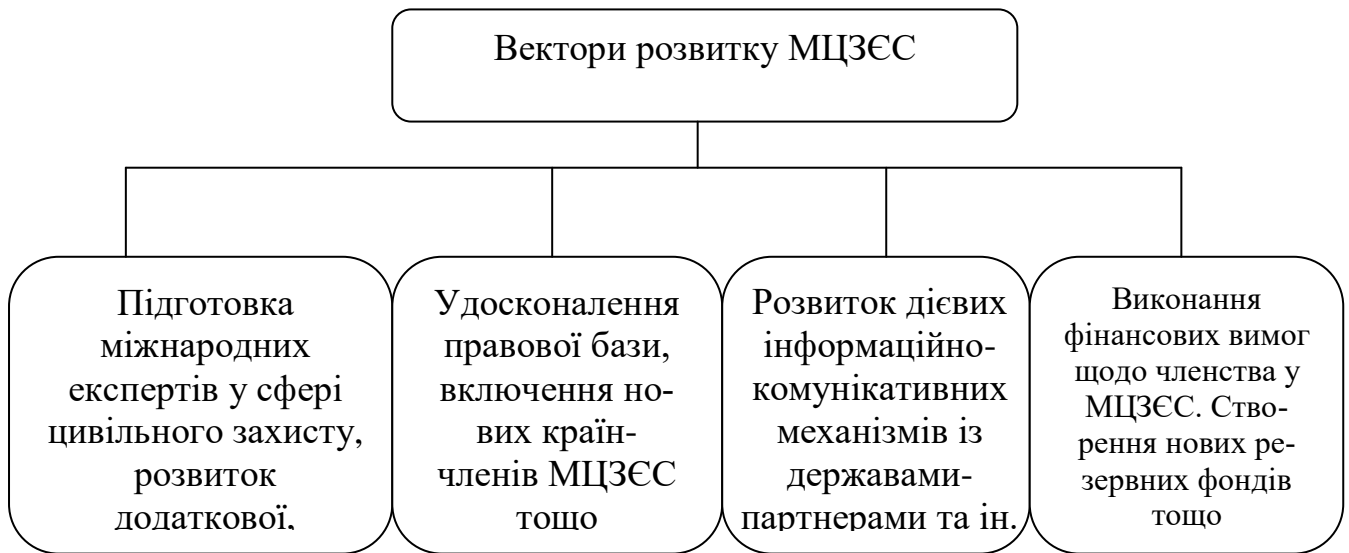
Рис. 2. Вектори розвитку МЦЗЄС

організаційно-правовий; інформаційно-комунікативний; матеріально-фінансовий (рис. 2).