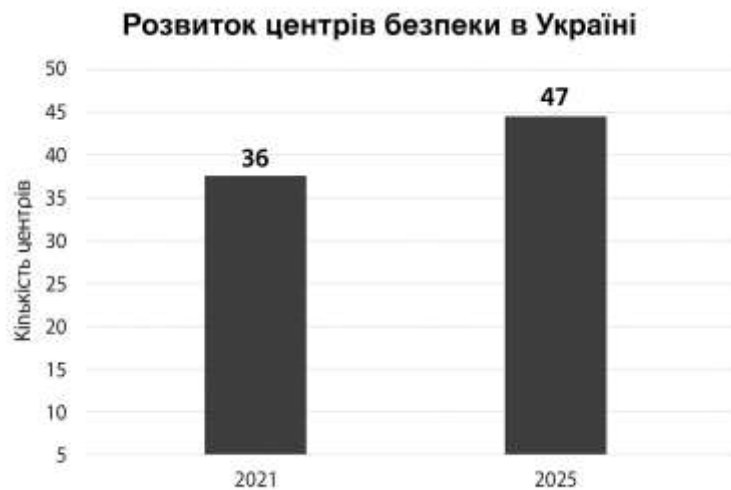
Рис. 2. Динаміка кількості центрів безпеки в Україні

Наприклад, у Німеччині місцеві пожежні служби складають 87% від загальної кількості. Вважаю, що Україна повинна імплементувати цю європейську модель, адаптуючи її до наших умов [2].