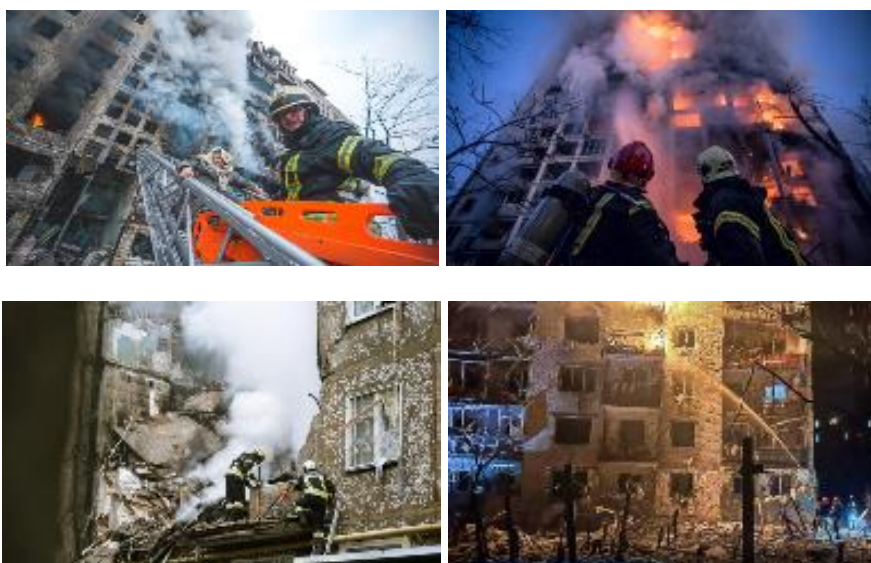
Рис. 1. Стан житлових будівель внаслідок ворожих обстрілів

Висотні будівлі зазнають значних руйнувань унаслідок постійних ворожих обстрілів. Хаотичне застосування різних типів боєприпасів і різноманітний характер пошкоджень зумовлюють необхідність удосконалення тактики ведення оперативних дій у висотних будівлях [1]. Під завалами часто опиняються люди з різними видами травм, які можуть перебувати на різних рівнях будівлі. З практичного досвіду рятувальників, основними причинами загибелі є синдром тривалого здавлювання, внутрішні кровотечі та несвочасне надання медичної допомоги. Стан будівель після ворожих обстрілів та складність проведення рятувальних робіт представлено на рис. 1.