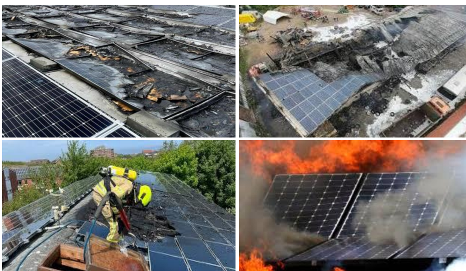
Рис. 1. Стан сонячних панелей внаслідок пожежі

Широке впровадження дахових і фасадних сонячних електростанцій (далі – СЕС) у будівлях різного призначення зумовлює появу нових факторів пожежної та електротехнічної небезпеки (рис. 1). Під час пожеж у будівлях, обладнаних СЕС, зберігається підвищена небезпека ураження електричним струмом через наявність напруги в DC-ланцюгах та роботу інверторного обладнання навіть після відключення об'єкта від зовнішньої мережі. Горіння ізоляції кабельних ліній спричиняє швидке поширення пожежі, інтенсивне задимлення і виділення токсичних продуктів горіння, а щільне розміщення фотоелектричних модулів на покрівлях ускладнює доступ до осередку пожежі та елементів знеструмлення [1, 2].